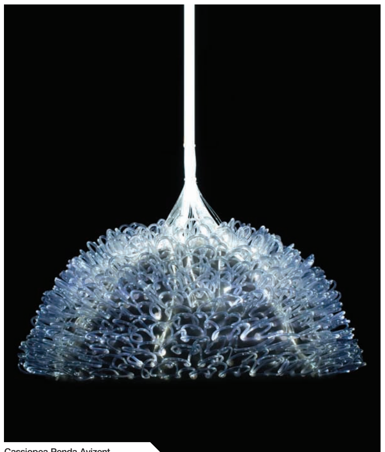
Cassiopea Penda Avizent